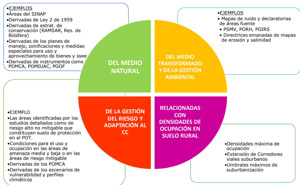
Figura 2.1 Agrupación de las determinantes ambientales por ejes temáticos

Para un mejor análisis de las determinantes ambientales, se propone una agrupación por ejes temáticos como muestra en la figura 2.1. Las AA encargadas de los procesos de concertación de los POT con los municipios y distritos deben asegurar que queden incorporadas en los POT la totalidad de las DA y no sólo aquellas de su competencia. A manera de ejemplo, las CAR deben asegurar la incorporación en los POT de los Parques Nacionales como determinante ambiental, así como del componente de riesgo; la primera competencia de PNN y la segunda, responsabilidad primaria de los municipios y distritos.