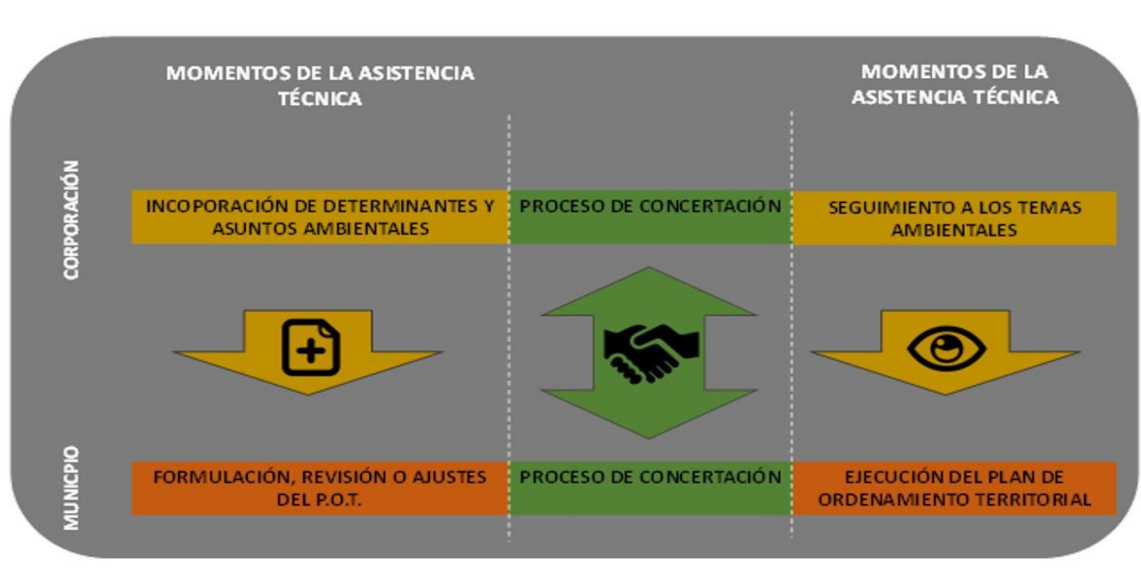
Figura 2.2 Asistencia técnica que deben dar las CAR a los municipios en el marco del ordenamiento territorial

La implementación de un sistema de información que consolide el registro de permisos, licencias y concesiones otorgadas, podrá servir de insumo tanto a los municipios para la toma de decisiones frente al modelo de ocupación territorial, como a la Autoridad Ambiental, para la actualización de determinantes para que sean tenidas en cuenta en la designación de usos del suelo, previendo posibles conflictos territoriales.