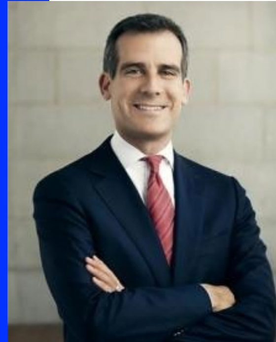
Eric Garcetti, Alcalde de Los Angeles, aliado de COP26 y presidente de C40

Comprométase en esta página https://www.c40knowledgehub.org/s/cities-race-to-zero?language=en_US